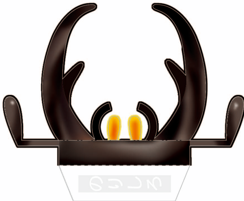
クワガタムシ はさみ